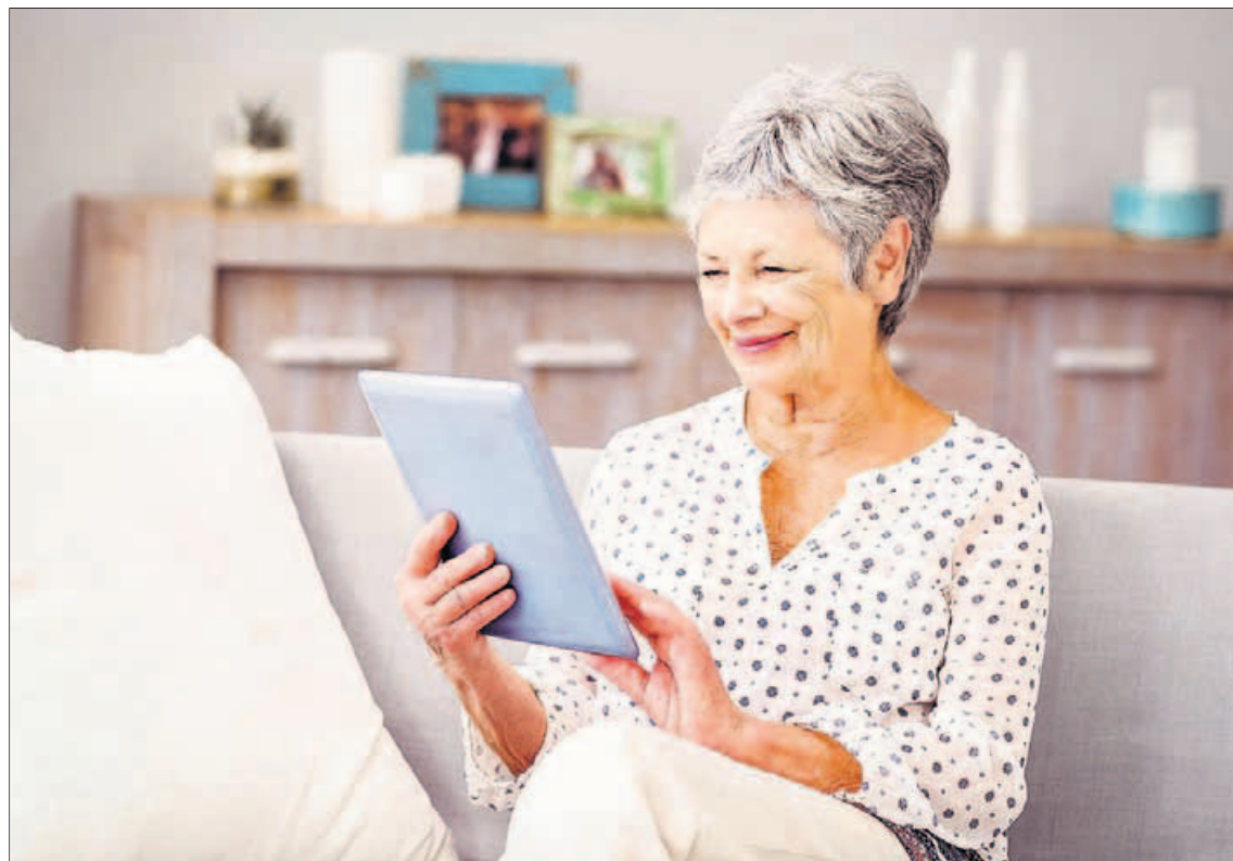
Actualmente la cirugía permite disfrutar de la lectura con una buena visión sin gafas.