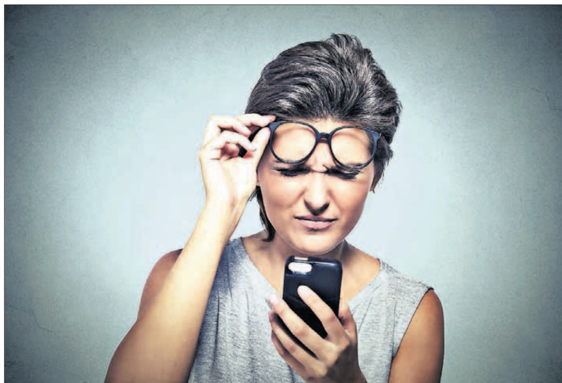
Una mujer con problemas de presbicia intenta enfocar la vista en su móvil.